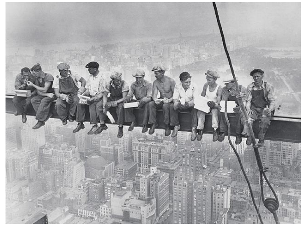
▲ Des ouvriers déjeunent au sommet d'un gratte-ciel en construction.

Les droits fondamentaux de l'Homme dans le domaine du travail sont notamment la liberté syndicale, le droit d'organisation et de négociation collective, l'abolition du travail forcé et du travail des enfants et l'élimination de la discrimination en matière d'emploi.