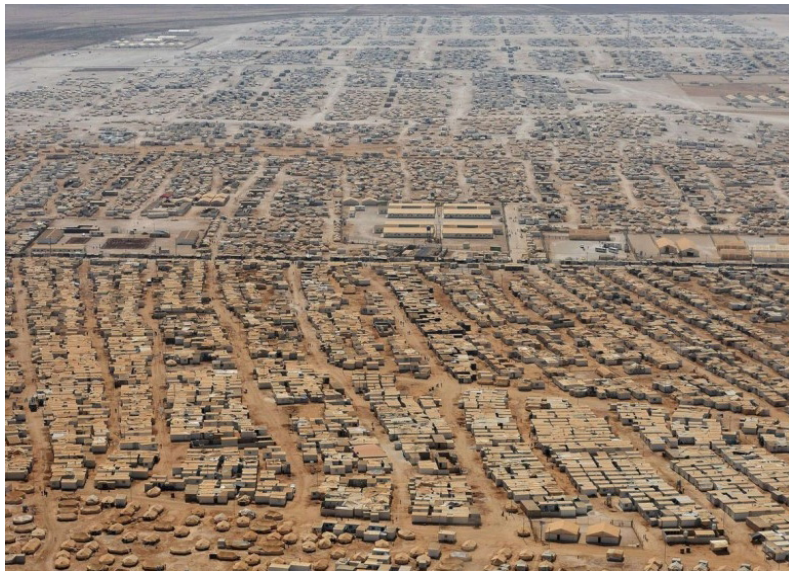
Camps de réfugiés syriens en Jordanie (2013)

Analyse l'image suivante et réponds aux questions.