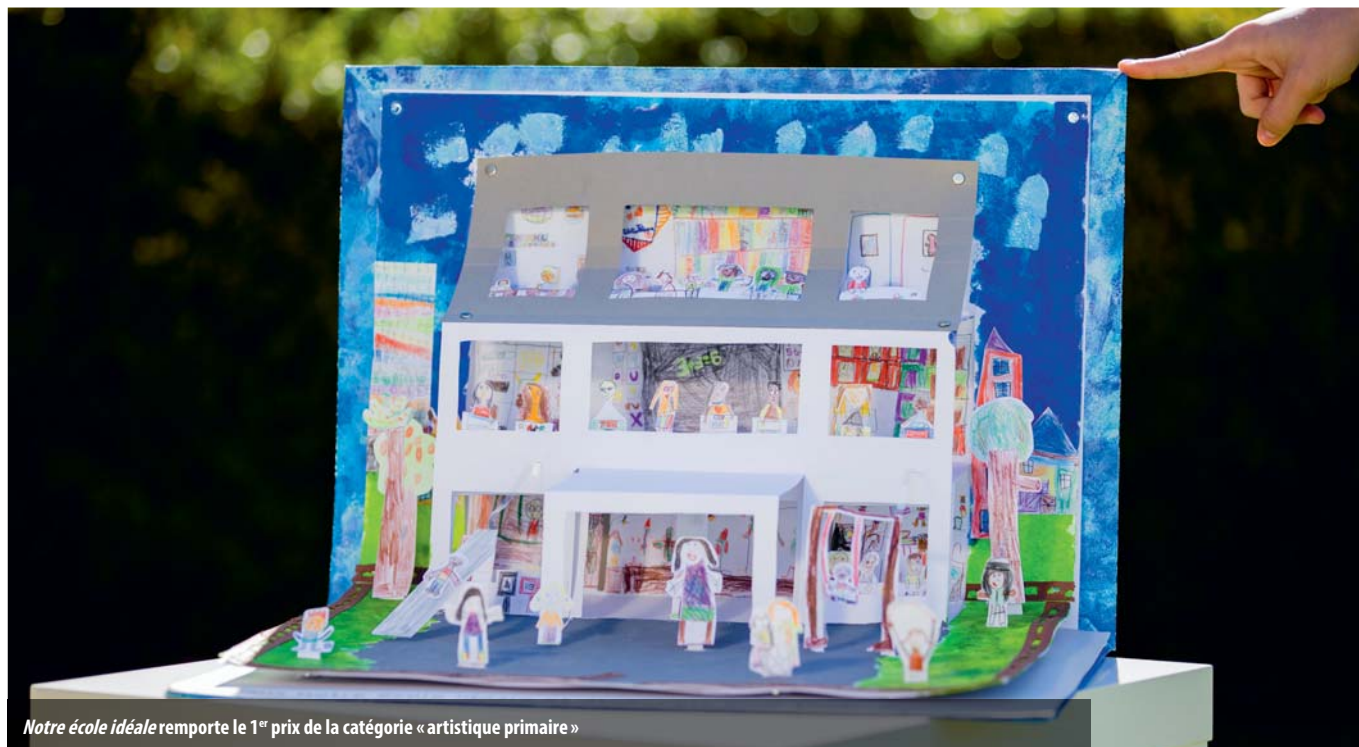
Notre école idéale remporte le 1 er prix de la catégorie « artistique primaire »

La Fondation Eduki organise chaque année un concours national sur la thématique de l'éducation. Trois classes de l'école des Libellules s'y sont illustrées !