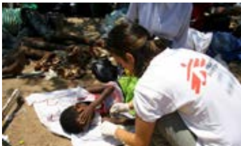
MSF traitant des cas de choléra au Zimbabwe en 2018.

L' aide humanitaire d'urgence est coordonnée par le Bureau de coordination des affaires humanitaires (OCHA). Après avoir rapidement étudié la situation de crise, il met au point, en relation avec certains organes de l'ONU, les États et les ONG , des stratégies communes d'action. Grâce au Plan commun d'action humanitaire, les tâches sont distribuées entre ces acteurs.