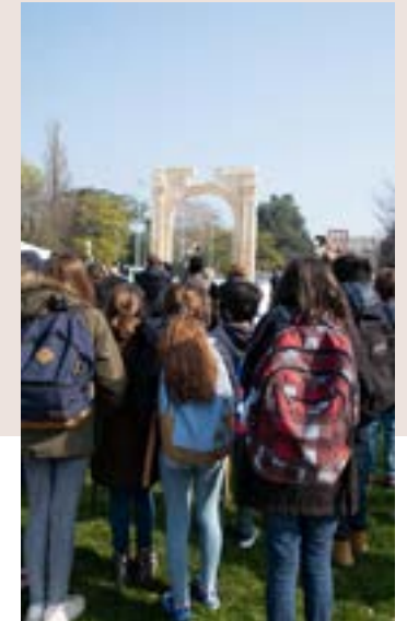
En 2019, à l'occasion des 70 ans de l'entrée de la Suisse à l'UNESCO, une réplique de l'arche de triomphe de Palmyre détruite en Syrie, a été dressée à Genève.

Pour en apprendre davantage sur la protection des biens culturels, consultez la fiche 9b culture.