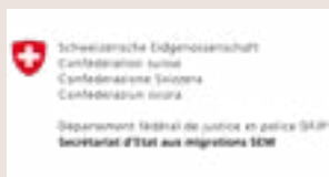
Secrétariat d'État aux migrations (SEM) (Berne)