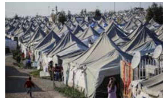
Camp de réfugiés syriens en Turquie

Ce sont des personnes qui ont quitté leur pays d'origine, ont demandé l'asile dans un autre pays et attendent une réponse à leur demande. Les procédures concernant les demandeurs d'asile varient d'un pays à l'autre. À l'échelle européenne, les accords de Dublin déterminent les compétences en matière d'asile entre chaque pays de l'Union européenne, la Norvège, l'Islande et la Suisse. Ces accords permettent ainsi de coordonner la politique d'asile et de lutter contre les abus.