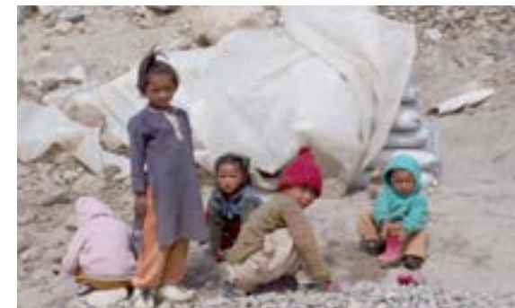
Enfants réfugiés en Inde