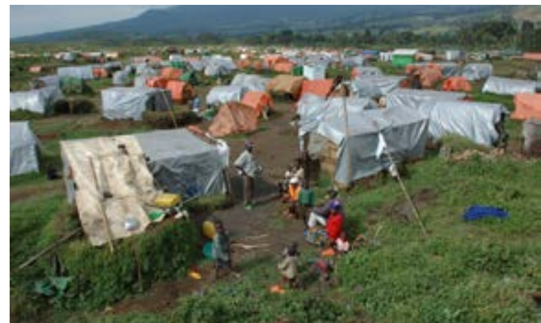
Camp pour personnes déplacées au Rwanda

On confond souvent le réfugié avec le migrant économique. Contrairement aux migrants, les réfugiés n'ont pas choisi de quitter leur pays : persécutés, ils ont été contraints de le faire. Les migrants économiques ne remplissent donc pas les critères du statut de réfugié et ne peuvent, par conséquent, pas bénéficier d'une protection internationale en tant que réfugiés. Ainsi, la différence clé entre les migrants économiques et les réfugiés est que les premiers jouissent de la protection de leur pays d'origine et peuvent y retourner lorsqu'ils le désirent ; ce qui n'est pas le cas des réfugiés.