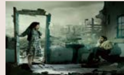
Campagne UNHCR « Refugees would like to have the same problems you have » de 2010.

Source : https://www.unhcr.org/fr/histoire-du-hcr.html#:~:text=En%201981%2C%20le%20HCR%20s,Moyen%2DOrient%20et%20en%20Asie. consulté le 02/10/2020