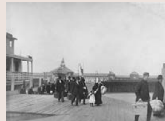
Immigrants historiques vers le rêve américain en 1900

Entre 1892 et 1924, 110'000 immigrants d'origine suisse débarquèrent à Ellis Island à New York, c'est le cas par exemple de la famille de mécènes Guggenheim.