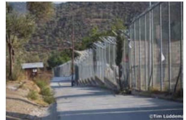
Camp de migrants Moria à Lesbos en Grèce

Bien que ces camps ont pour but d'assurer une sécurité aux personnes déplacés, ceux-ci ressemble souvent à un centre de détention où dans des conditions de vie sont misérables entraînant ainsi la propagation de maladies et de violences.