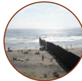
Plage de Tijuana sur l'océan Pacifique. À gauche : le Mexique, à droite : les États-Unis.